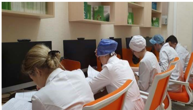
Рис. 2. Теоретический этап первичной специализированной аккредитации

Организация проведения аккредитации строго следует требованиям приказа Минздрава России от 30.11.2021 № 1081н «Об утверждении Положения об аккредитации специалистов» (рис.2):