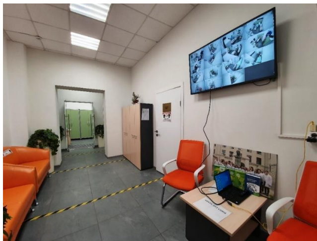
Рис. 6. Объективность и доказательность оценки аккредитуемых лиц на всех этапах проведения аккредитации визуализируется на общем экране для всех членов комиссии