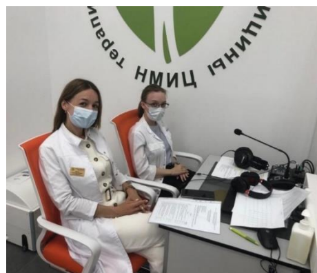
Рис. 8. Проведение Государственной итоговой аттестации ординаторов