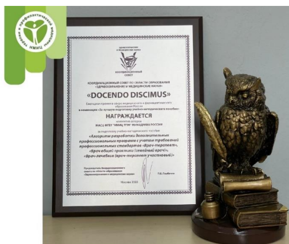
Рис. 11. Коллектив авторов МАСЦ награжден ежегодной Премией в сфере медицинского и фармацевтического образования России в номинации «За лучшую подготовку учебно-методического пособия»