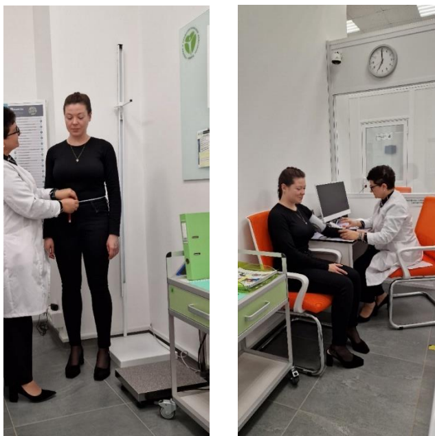
Рис. 7. Станция «Диспансеризация»

Для реализации разработанного дидактического материала в МАСЦ подготовлена и оснащена станция «Диспансеризация» в соответствии с действующими приказами Минздрава России (рис. 7).