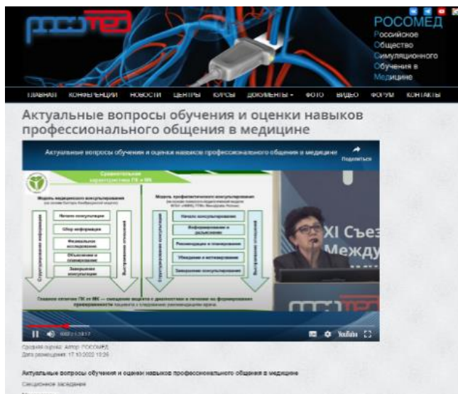
Рис. 9. Доклад руководителя МАСЦ С.Ю. Астаниной «Модель формирования умений профилактического консультирования»