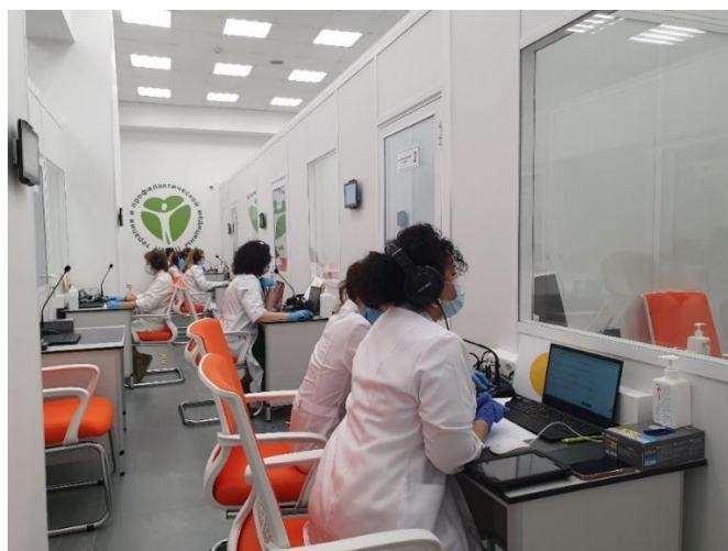
Рис.5. Члены АПК в работе оценивают уровень сформированности практических навыков у аккредитуемых врачей