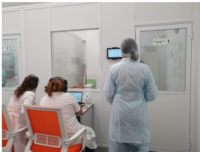
Рис. 3. Перед входом на станцию аккредитуемые лица знакомятся с проблемной ситуацией