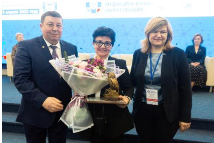
Рис. 10. Награждение премией в сфере медицинского образования России Координационного совета по области образования «Здравоохранение и медицинские науки»